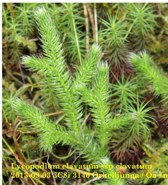
Lycopodium clavatum ssp. clavatum 2013-09-03 3C8i 3146 Örkelljunga / Öa sn