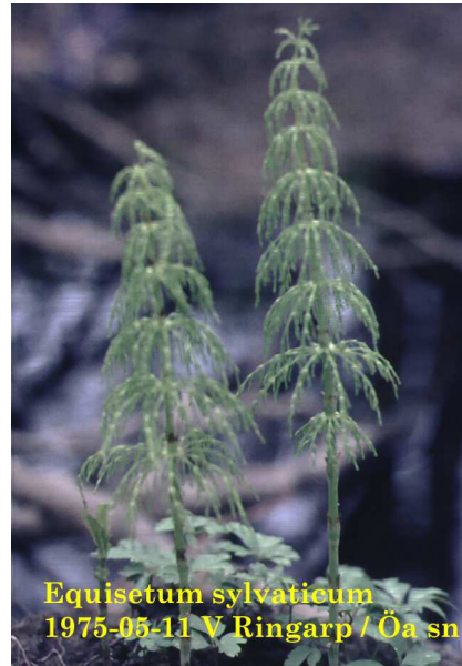
Equisetum sylvaticum 1975-05-11 V Ringarp / Öa sn